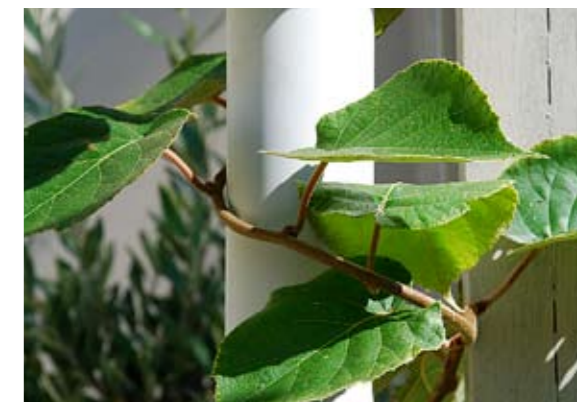
Langs de regenpijp bij de serre werkt een kiwiplant (3) zich omhoog.

De beplanting is lieflijk en bloemrijk. Gekozen is voor roze, beige, witte en lichtblauwe bloeikleuren en voor planten die doorbloeien of lange tijd sierwaarde hebben. In de plantvakken rondom het kleine terras zorgen rijk bloeiende planten zoals bergsteentijm ( Calamintha ), Gaura , zonnehoed ( Echinacea ) en lampenpoetsergras maandenlang voor een aantrekkelijk beeld. Twee bolkastanjes geven in dit gedeelte hoogte aan de tuin, terwijl buxusbollen en camelia voor een groen accent in de winter zorgen. Tegen de hoge noordoostmuur bij het hardhouten terras zijn drie klimrozen geplant. Rozen in de schaduw, kan dat wel? Mathieu De Telder: „Dit is noisetterooz 'Mme Alfred Carrière', een doorbloeiende roos die het zelfs in de volle schaduw goed doet.“ Verderop in de tuin, boven het pad aan de zijkant van de woning, komt deze roos terug. Hier zijn enkele staalkabels gespannen die op termijn geheel begroeid zullen zijn met deze krachtig groeiende klimroos, die 's zomers heerlijk geurende roomwitte bloemen geeft.