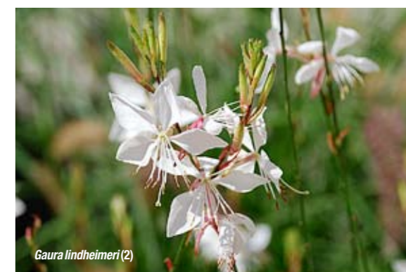
Gaura lindheimeri (2)