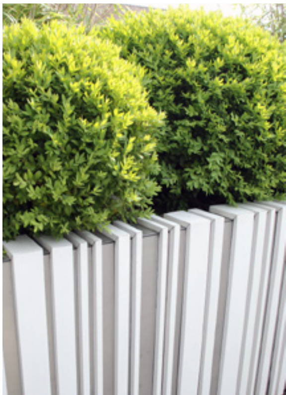
Deze plantenbak is uniek; de witgeschilderde latjes die er op zijn aangebracht, zijn geïnspireerd op een barcode.